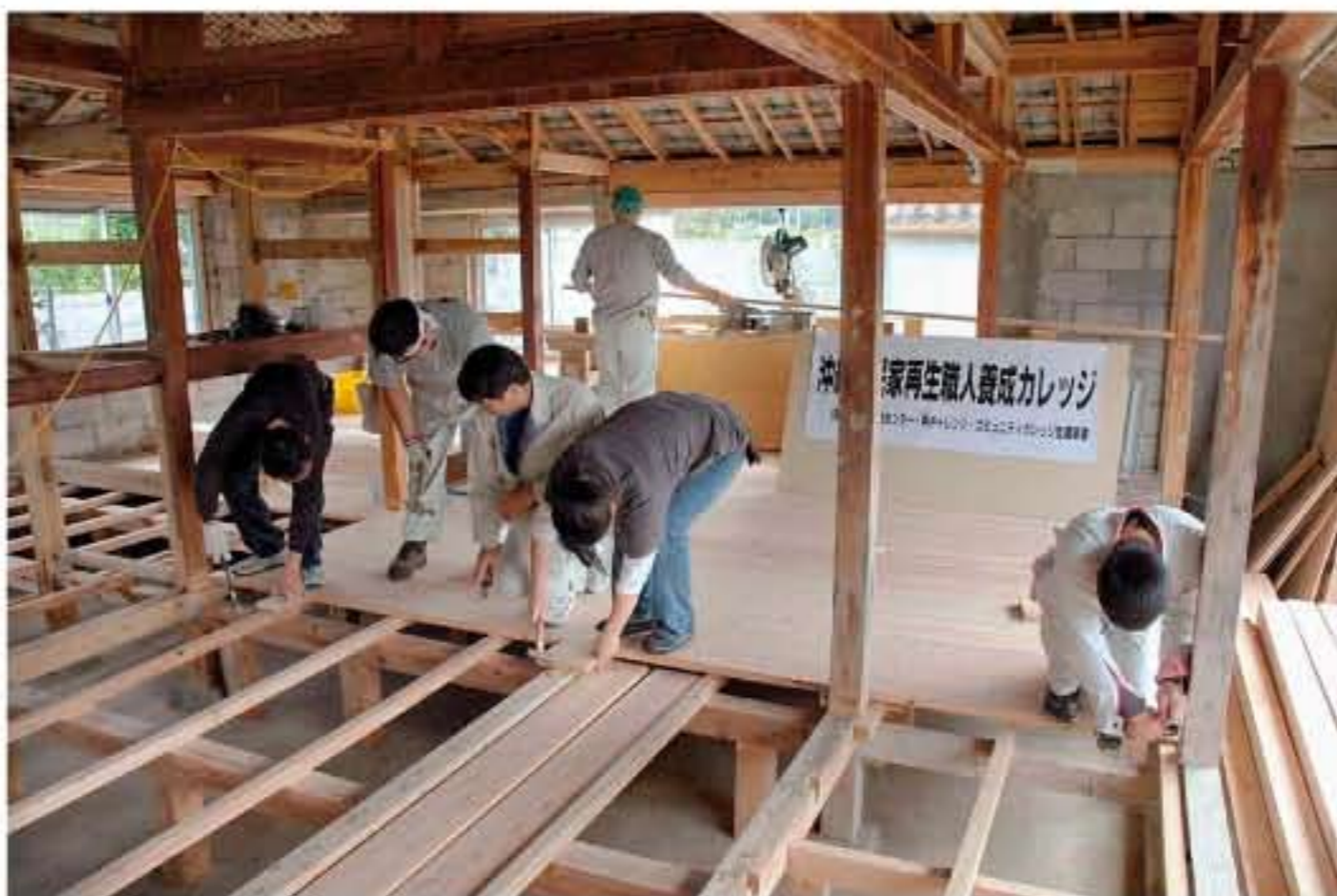
「島の風」のメンバーらは、こつこつと古民家の再生を進めてきた。2008年10月、伊是名村